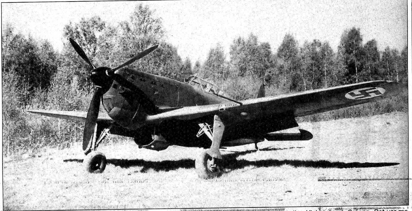
Moderna. Det var tre plan av denna typ, Morane-Saulnier från Frankrike, som nödlandade mellan Visingsö och Gränna. Det var moderna plan på sin tid och piloterna hade aldrig flugit dem tidigare.