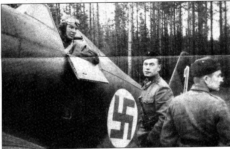
Tyskar. De finska planen var utsmyckade med stora blåa hakkors. För finnarna stod dock symbolen för andra värden än för tyskarna även om Tyskland och Finland tillsammans stred mot Sovjetunionen.