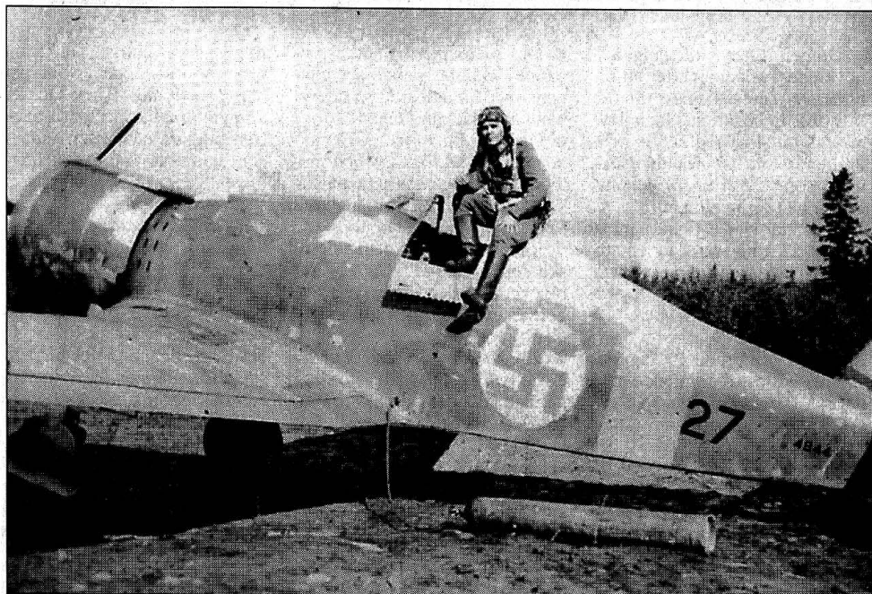
Lång färd. Unga och oerfarna piloter sändes civilklädda till Sverige under det finska vinterkriget. I Malmö eller Trollhättan hämtade de utländska flygplan som sedan flögs hem till Finland. Flygplanen var utsmyckade med blåa hakkors och Finland och Tyskland stred på samma sida mot Sovjetunionen.

I I I ■ i o st r p h l r ö o s i J l r l